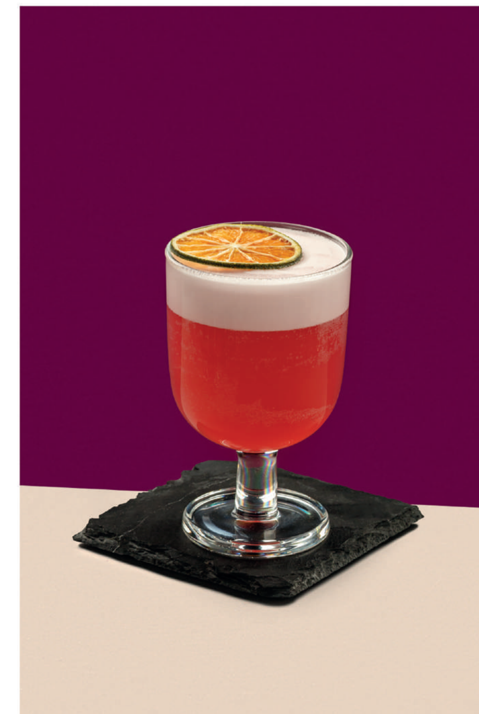
Рецепт №3 210 490 водка, кордиал из ромашки с клюквой, волшебство