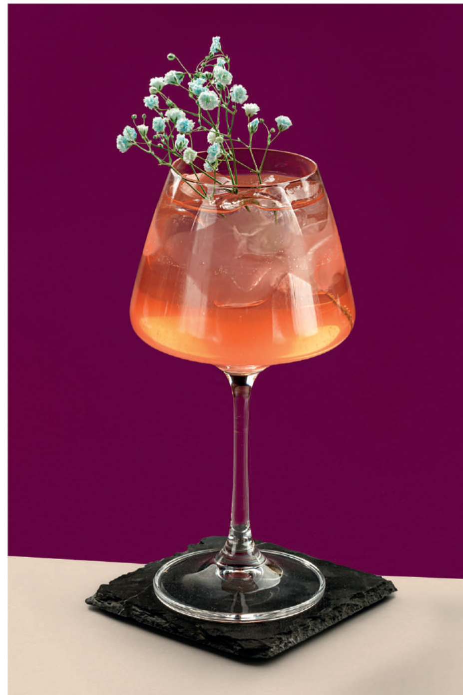
Рецепт №5 250 490 водка, содовая со сливой, алоэ и саган-дайля (чай)