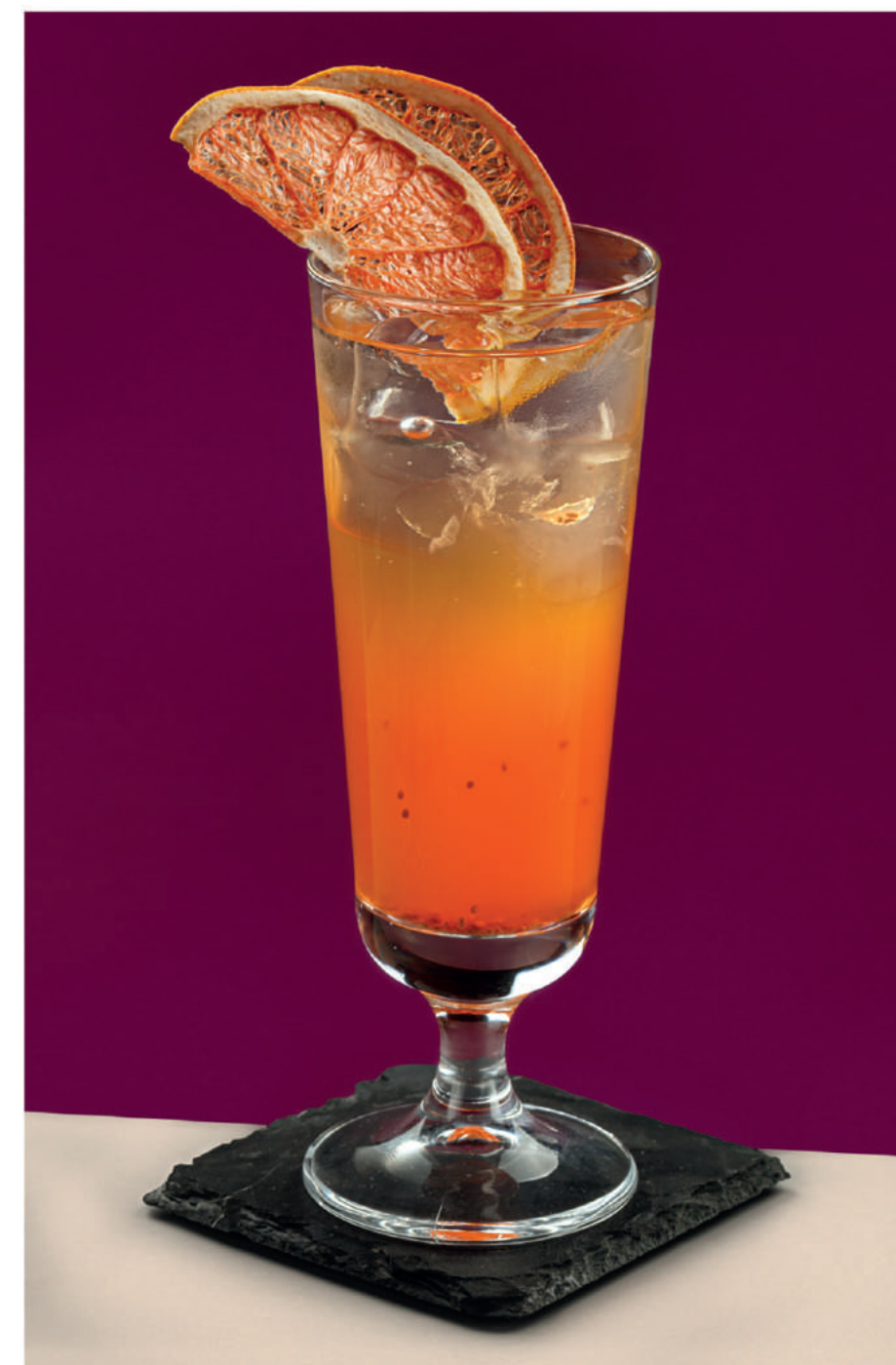
Рецепт №2 220 490 водка, апероль, ананасовый тепаче, брют, сок лайма, семена чиа