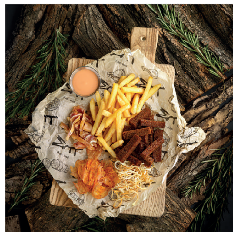
ПЬЯНЫЙ БАШМАЧНИК 340/40 700 Куриные джерки, луковые кольца, сулгуни, ржаные гренки, картофель фри и копченые свиные уши. Подается с соусом коктейль.