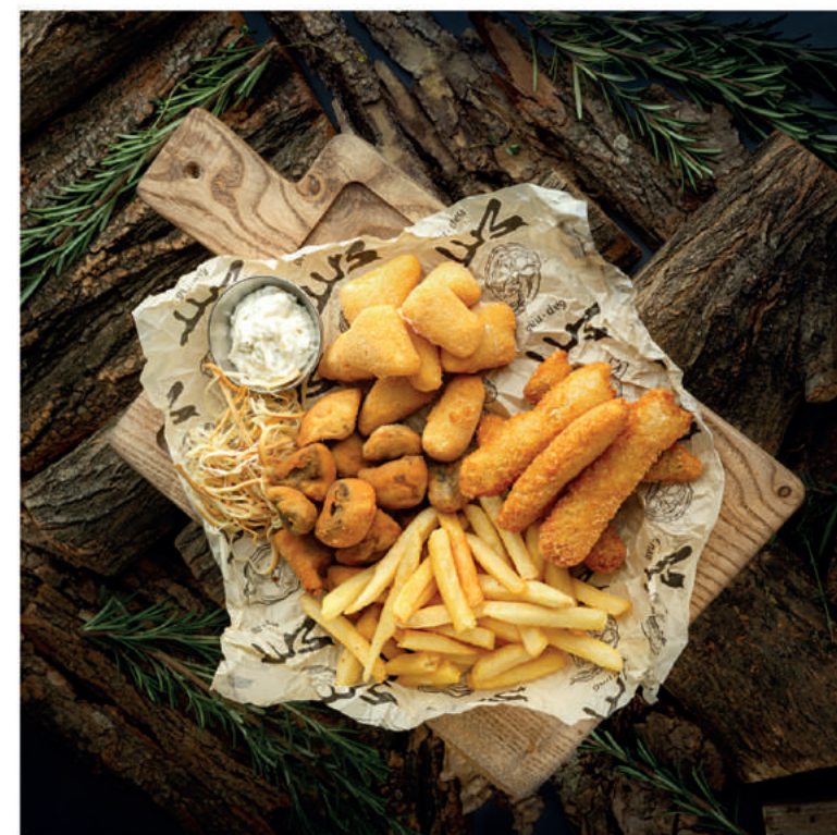
ПИВОЗАВР 500/40 790 Рыбные стрипсы, грибы фри, сыр фри, картофель фри и сулгуни. Подается с фирменным соусом тартар.