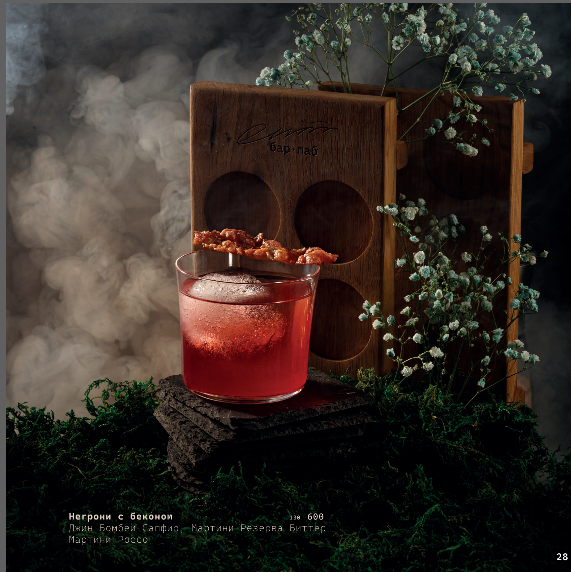
Негрони с беконом 130 600 Джин Бомбей Сапфир, Мартини Резерва Биттер, Мартини Rosso