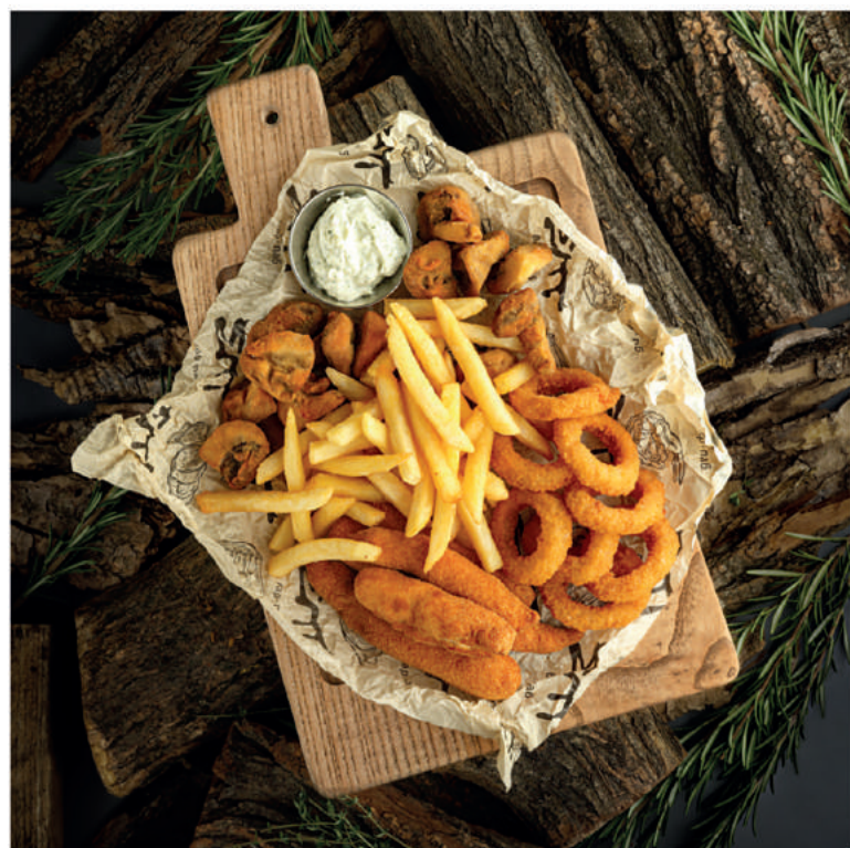
БИРПАТИ 500/40 790 Максимально рекомендуем! В этом наборе: луковые кольца, куриные палочки, грибы фри и картофель фри. Хорошо сочетается с кувшином пива.