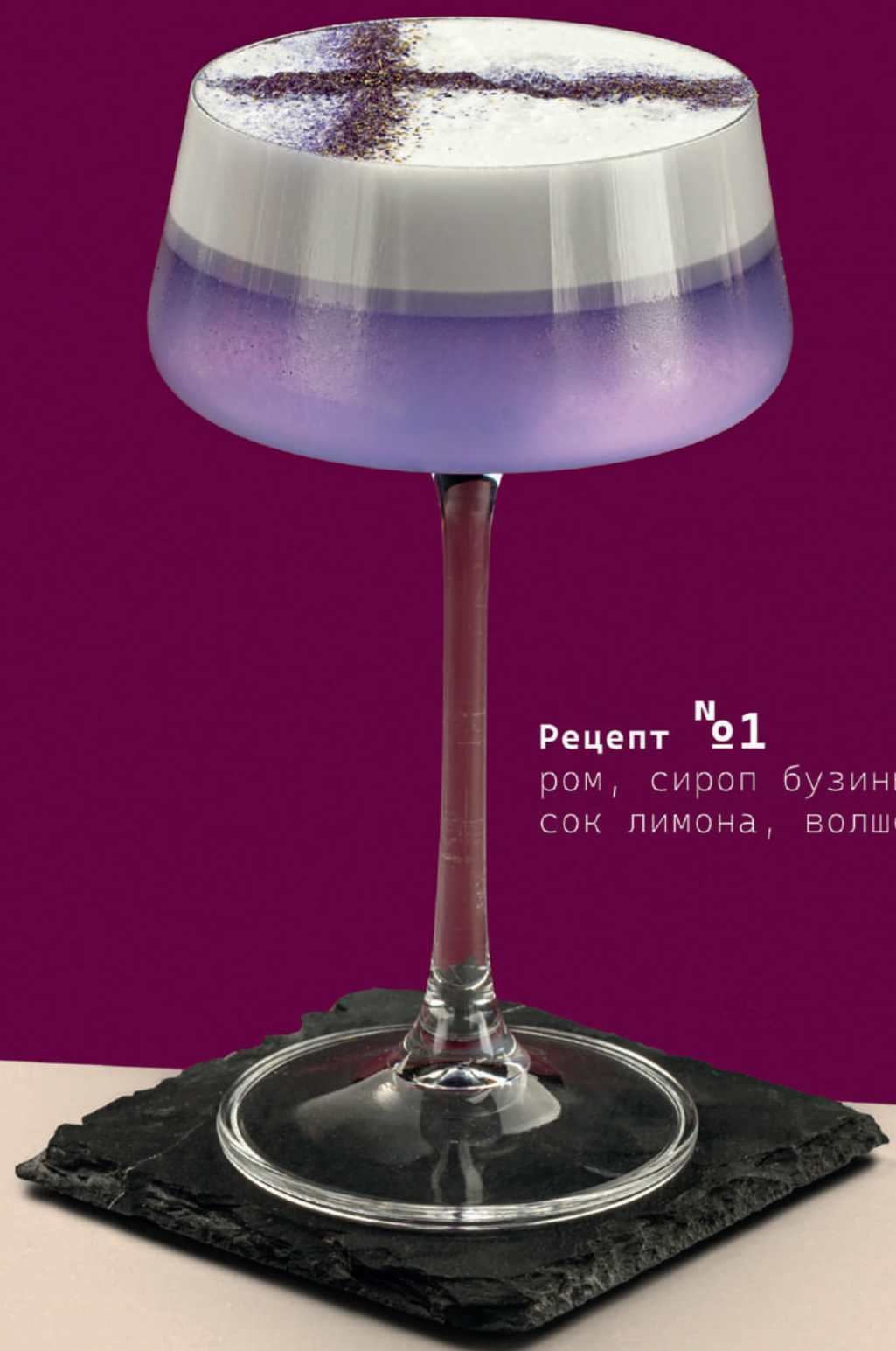
Рецепт №1 160 490 ром, сироп бузины, алоэ, сок лимона, волшебство