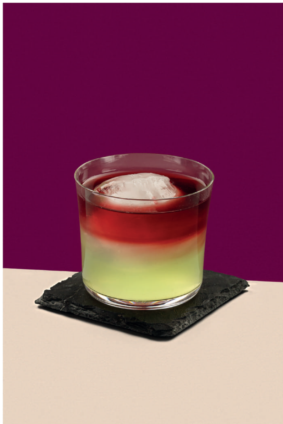
Рецепт №4 160 490 джин, кордиал из дыни и персика, сироп, красное вино