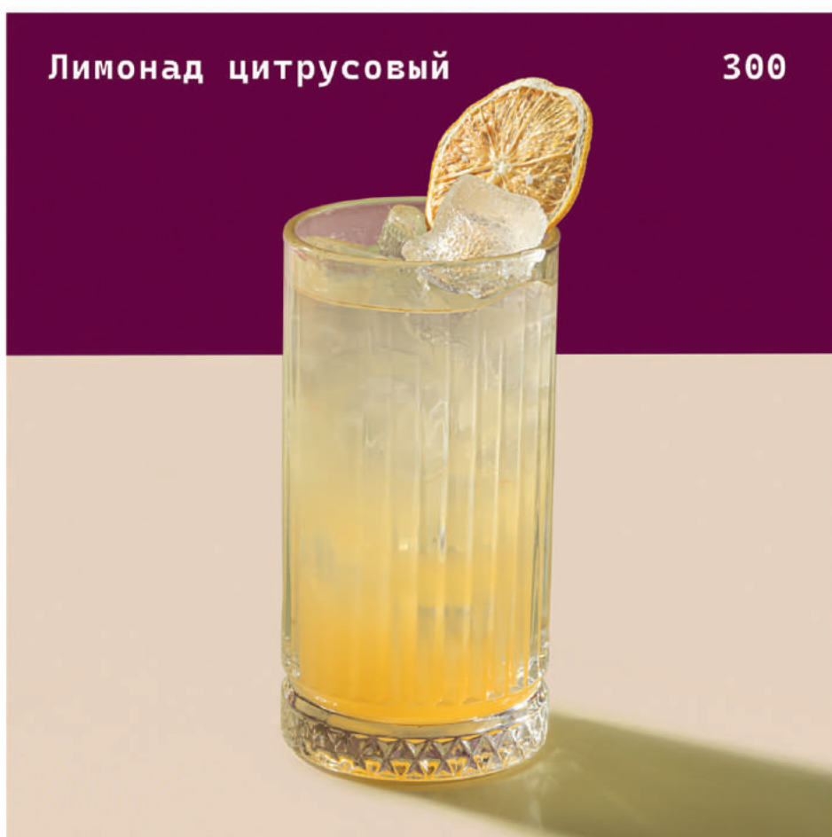
Лимонад цитrusовый 300