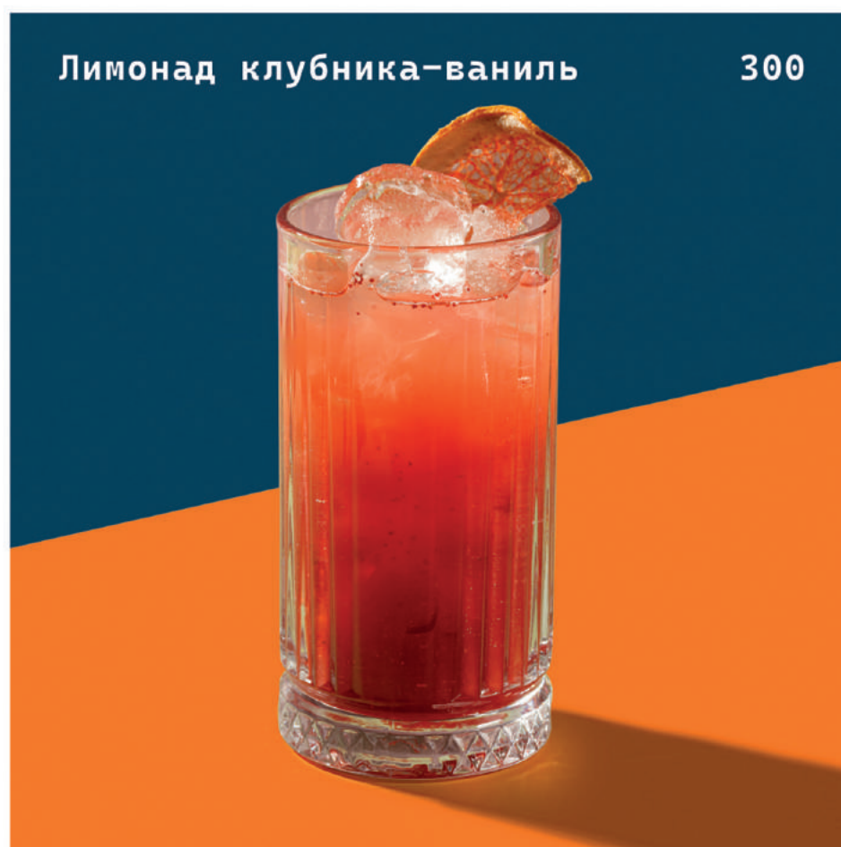
Лимонад клубника-ваниль 300