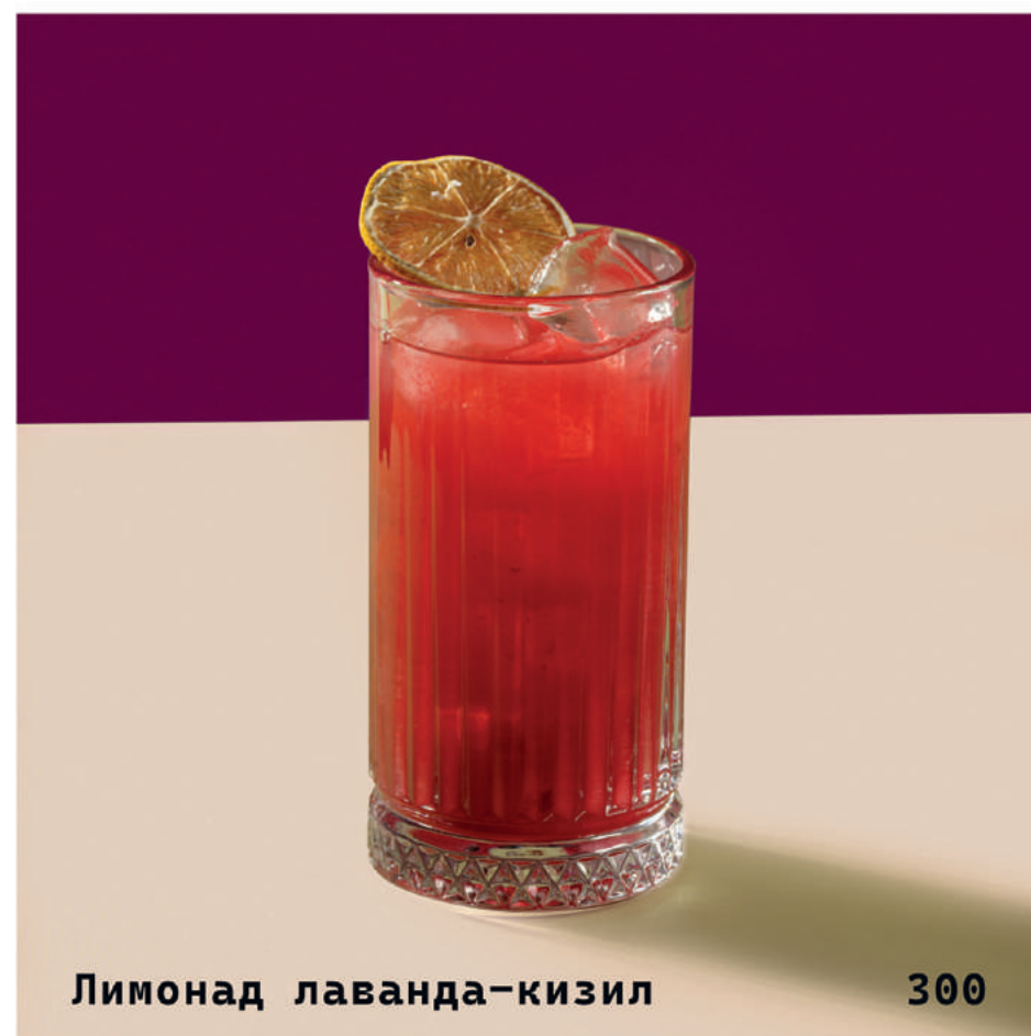
Лимонад лаванда-кизил 300